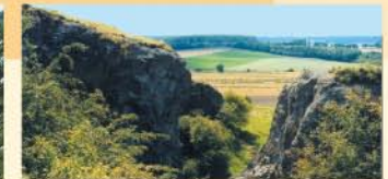
Hüssenberg bei Eissen