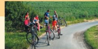
Radweg entlang der Nethe

Nach diesen Mühen geht es jedoch schon entspannt zurück nach Peckelsheim. Auf Ihrem Weg zurück zum Ausgangs- bzw. Endpunkt der Börderoute passieren Sie die evangelische Trinitatiskirche, ein Werk des spätklassischen Baukünstlers Karl Friedrich Schinkel aus dem Jahr 1840/41.